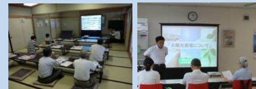
セミナーの様子 (左：南ヶ丘公民館/右：秦野ガス)

夏と冬の電気量がわかる電気検針表、立面図などを お持ちいただければ詳しくシュミレーションができます。